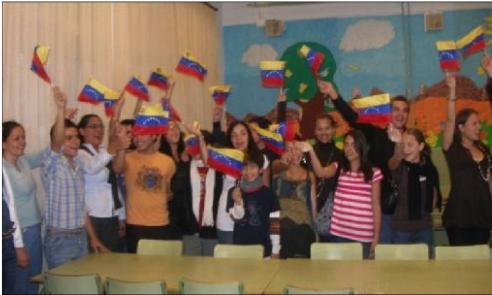
Fiesta de despedida en la que participó la Fundación Juan Perán-Pikolinos.

La Asociación Cultural Tateiju España está hermanada con su homóloga Tateiju Venezuela. Es una asociación sin ánimo de lucro dedicada a la formación de niños y jóvenes a partir de la enseñanza del teatro y la música. Entre uno de sus objetivos está la cohesión e integración de ambas culturas.