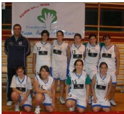
Club Baloncesto Aspe.

En la actualidad cuenta con 9 equipos con un total de 120 participantes. De ellos hay 2 equipos senior masculinos, un junior masculino y el resto son de base (chicos y chicas). Juegan en el Pabellón de Aspe.