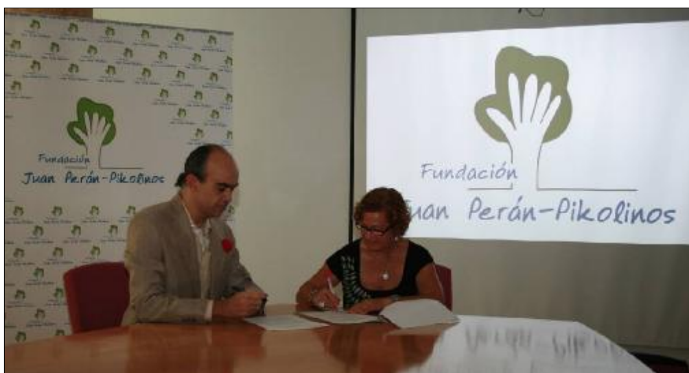
Firma del convenio de colaboración con PAYASOSPITAL.

PAYASOSPITAL es una Asociación sin ánimo de lucro fundada en 1999. Es una asociación de payasos profesionales, especialmente formados para intervenir en los servicios de pediatría de los hospitales. Su misión es contribuir a la mejora de la calidad de vida de los niños hospitalizados, sus familias y el personal que los atiende, a través del humor, la risa y la fantasía.